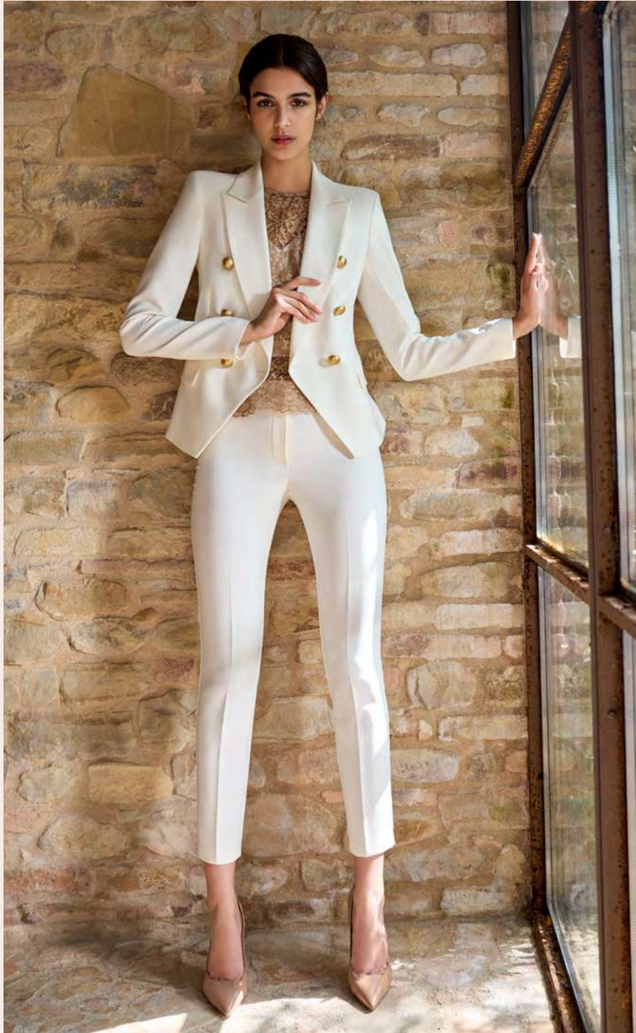
JACKET CFC0105020 - TOP CFC0105502 - TROUSERS CFC0105038 - SHOES CAL0006300