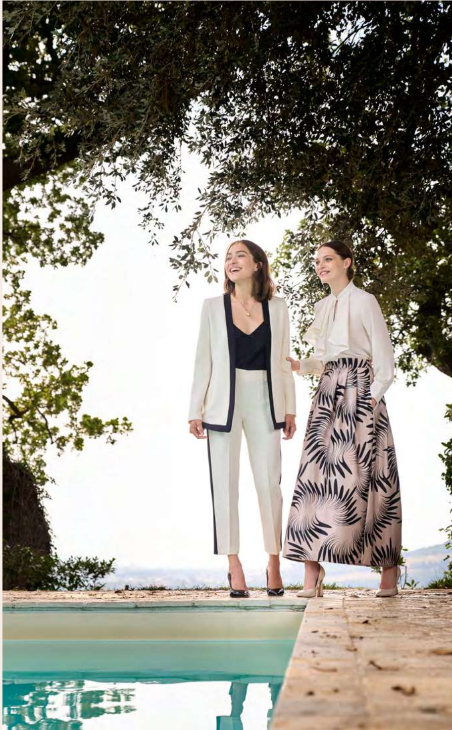
▲ SUIT CFC0104890 - TOP CFC0096657 ▲ BLOUSE CFC0104776 - SKIRT CFC0104476 - SHOES CAL0006297