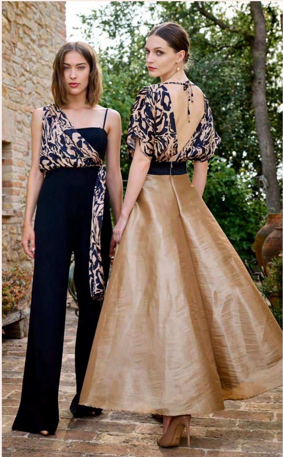
◀ JUMPSUIT CFC0104548 - SHOES CAL0006297