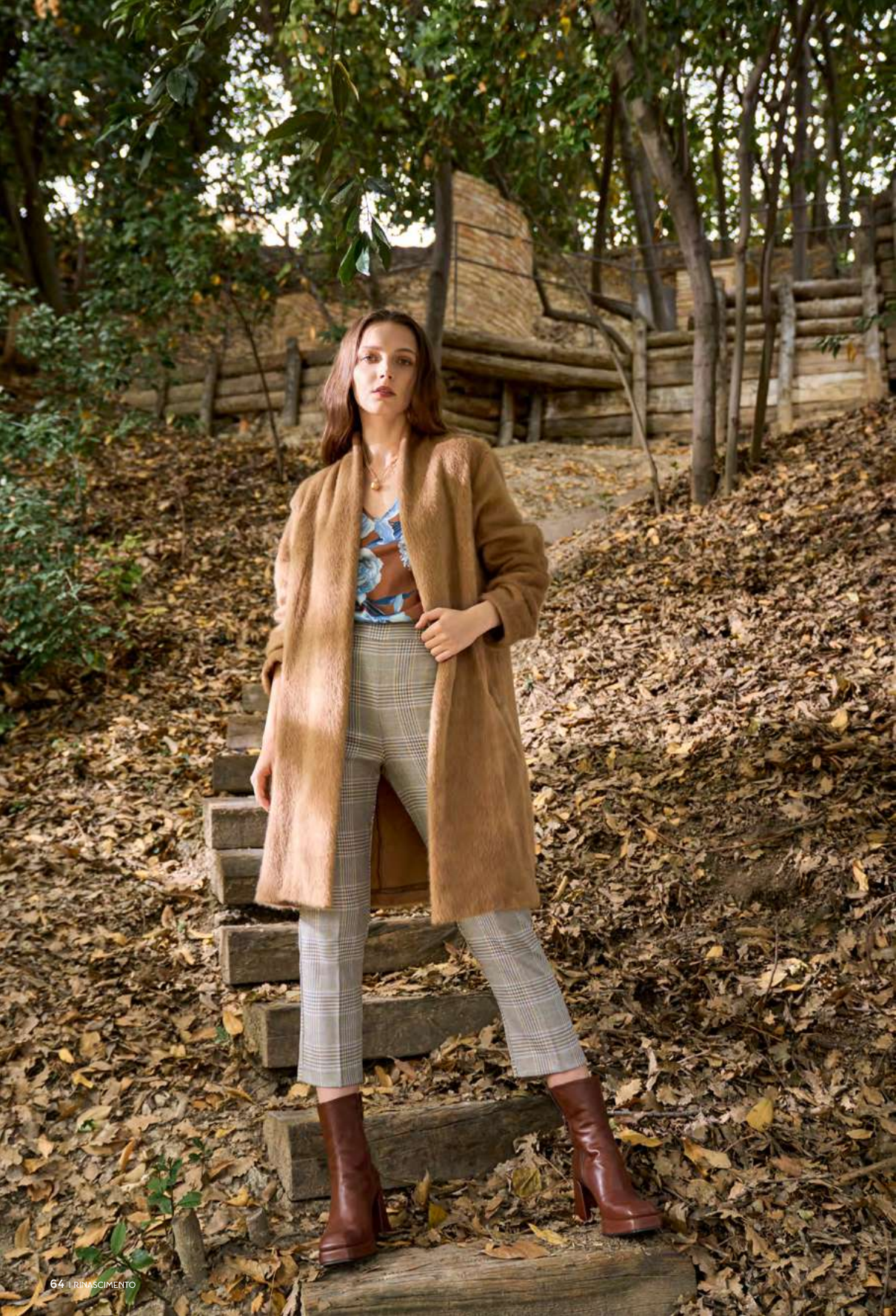
COAT CFC0104991 - TOP CFC0105435 - TROUSERS CFC0104433 - BOOTS CAL0006312