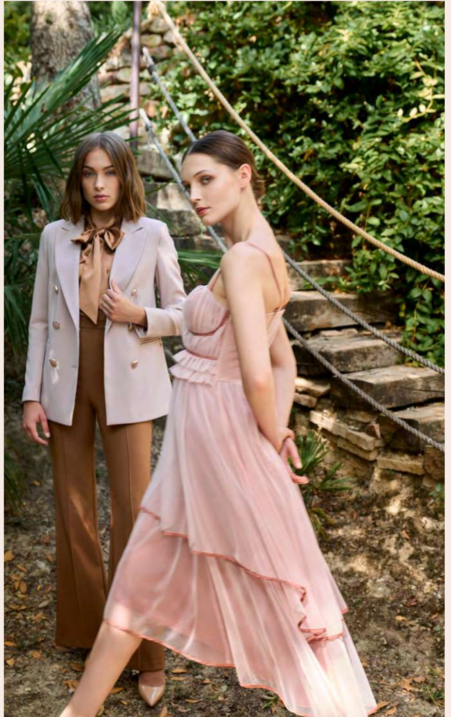
▲ JACKET CFC0105019 - TOP CFC0105025 - TROUSERS CFC0105061