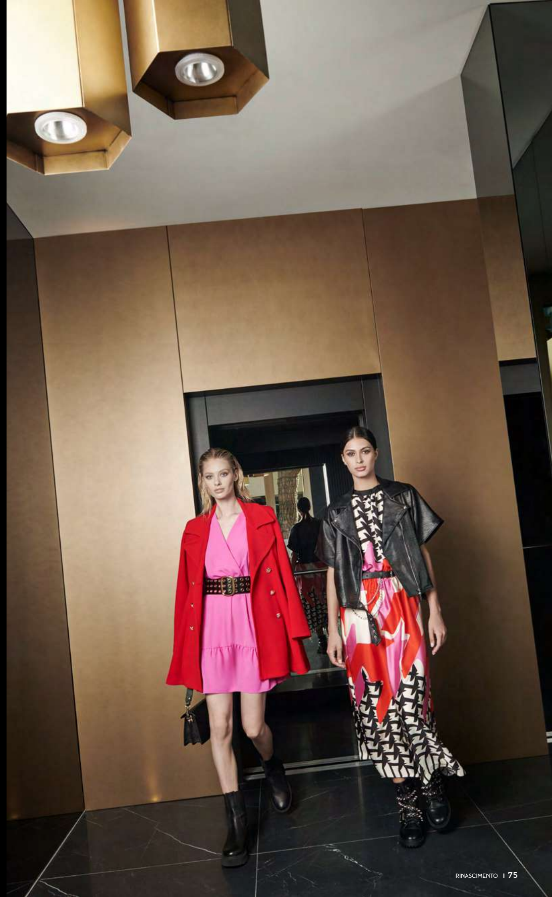
COAT CFC0104971 - DRESS CFC0103974 - BELT ACV0012983 - BOOTS CAL0006325 | JACKET CFC0104902 - DRESS CFC0104821 - BELT ACV0012997 - BOOTS CAL0006303