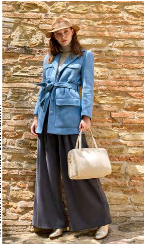
HAT ACV0013040 - BAG ACV0012923 - BOOTS CAL0006314