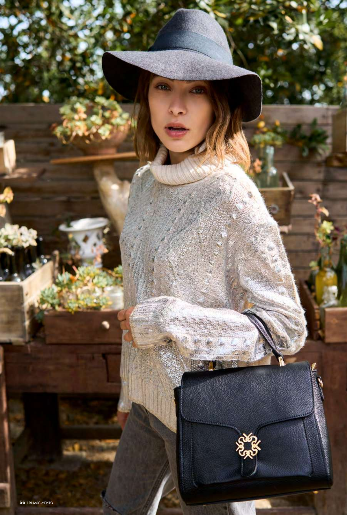
SWEATER CFM0010448 - JEANS CFC0103925 - HAT ACV0013041 - BAG ACV0012987 - BOOTS CAL0006325