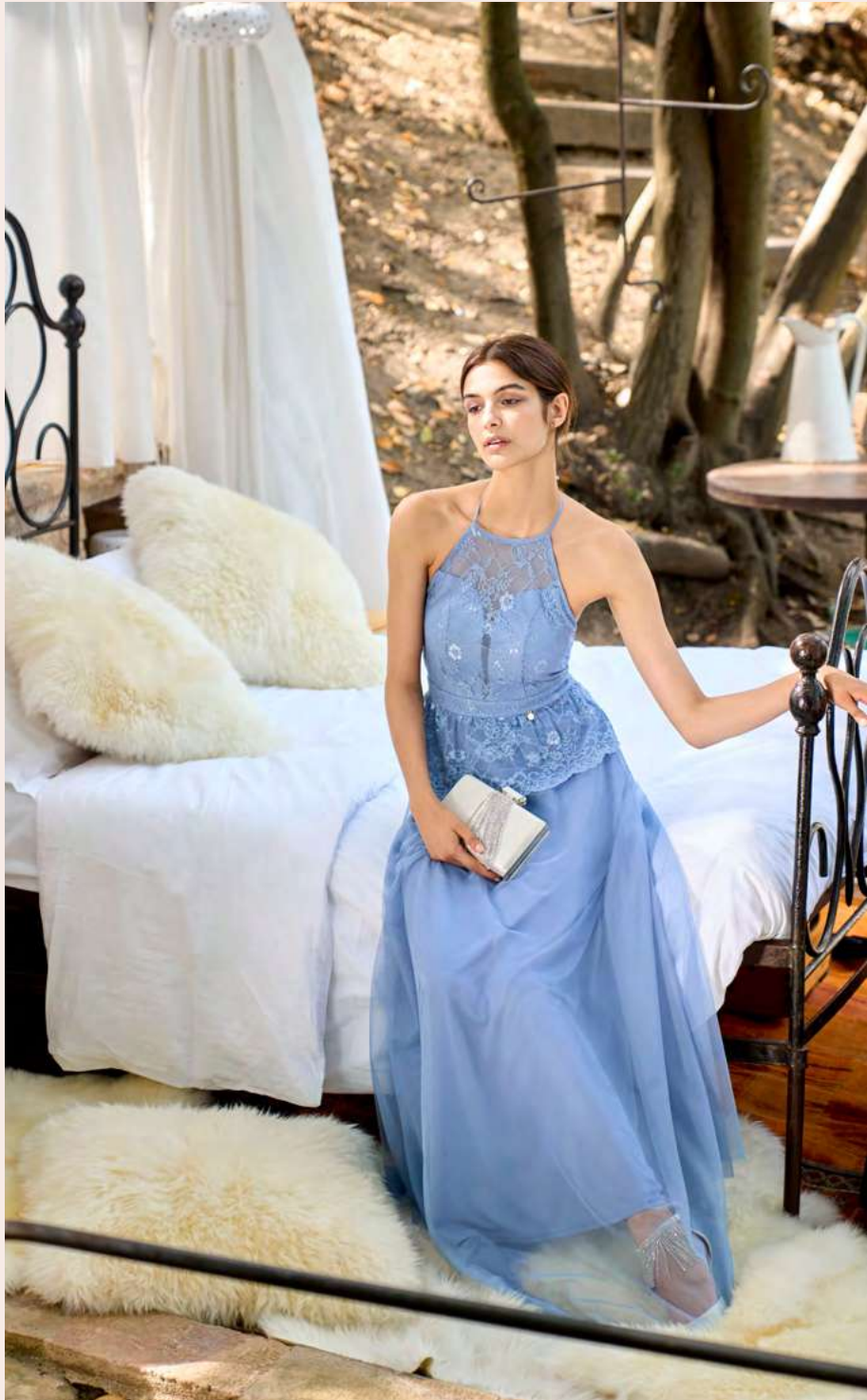
DRESS CFC0104894 - BAG ACV0012649 - SHOES CAL0006150