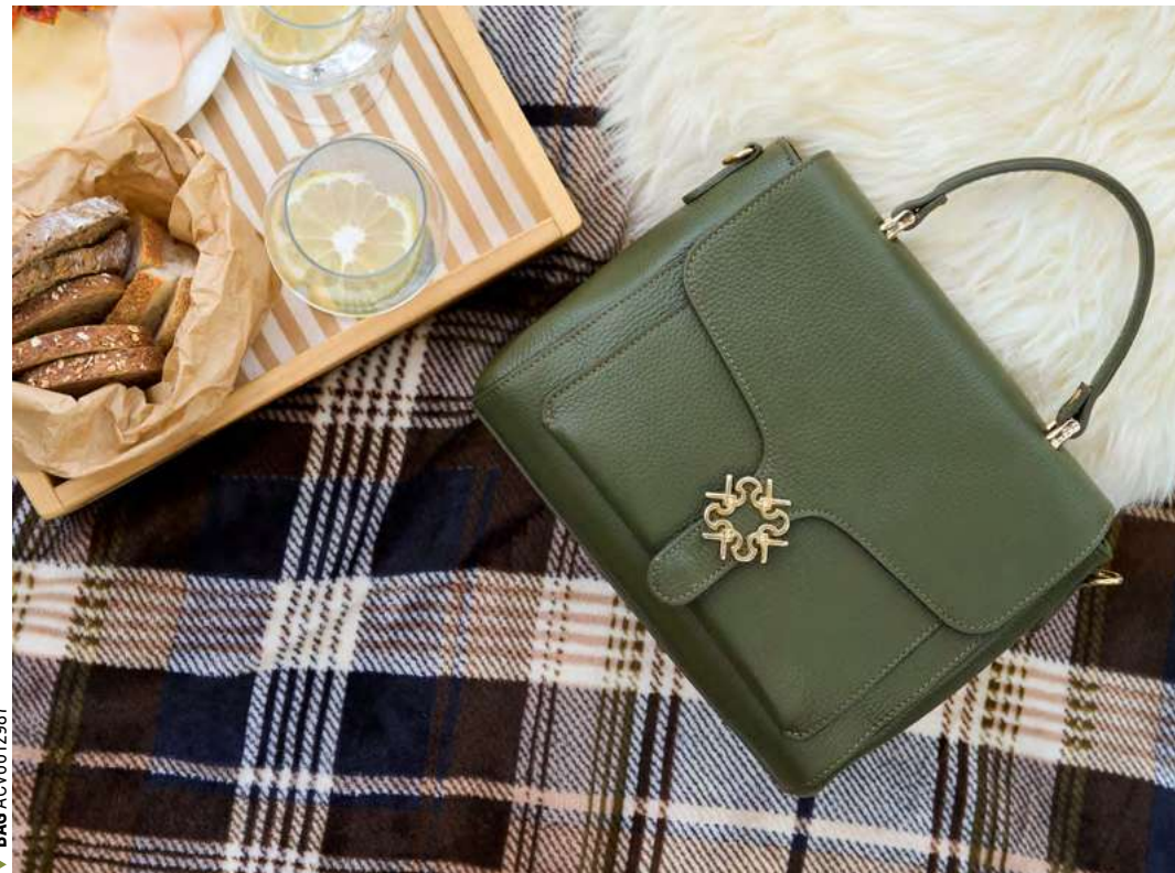
▼ BAG ACV0012987