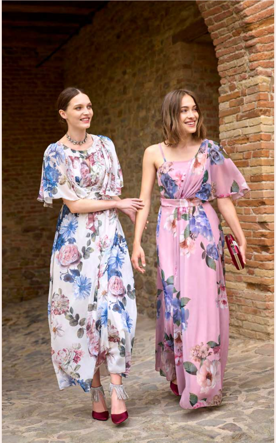
◀ DRESS CFC0104721